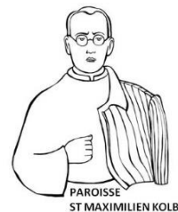
PAROISSE ST MAXIMILIEN KOLBE

- Pèlerinage en Terre Sainte organisé par le pôle d'Argentan : du 12 au 20 octobre prochain. Inscription à faire dès maintenant.